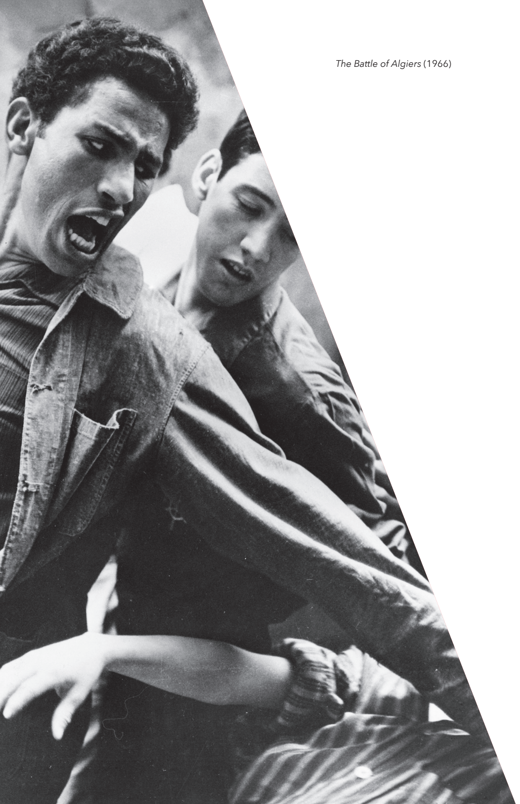
The Battle of Algiers (1966)