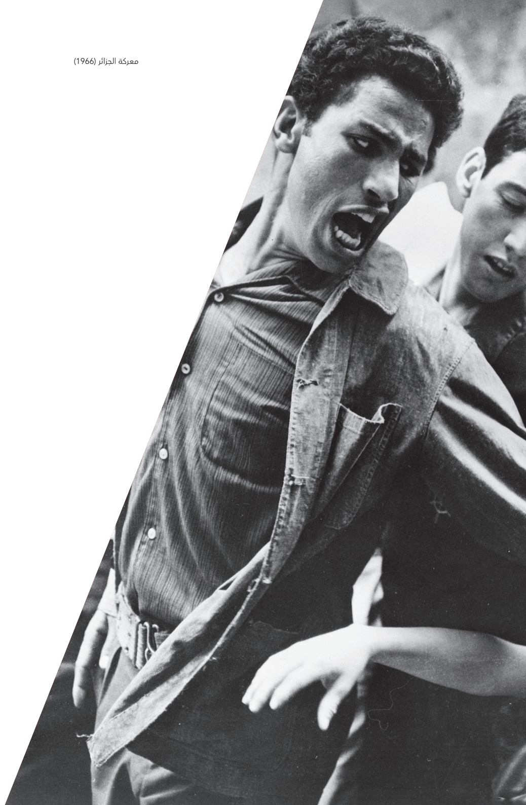
معركة الجزائر (1966)