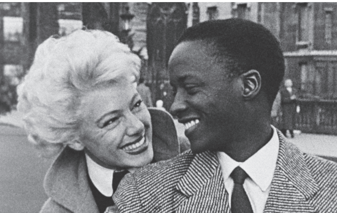
Afrique sur Seine (1955)