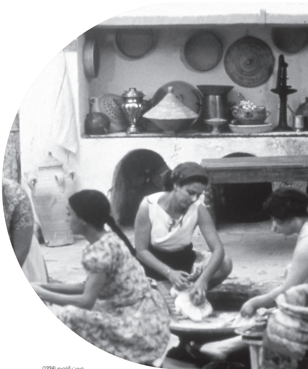
صمت القصور (1994)