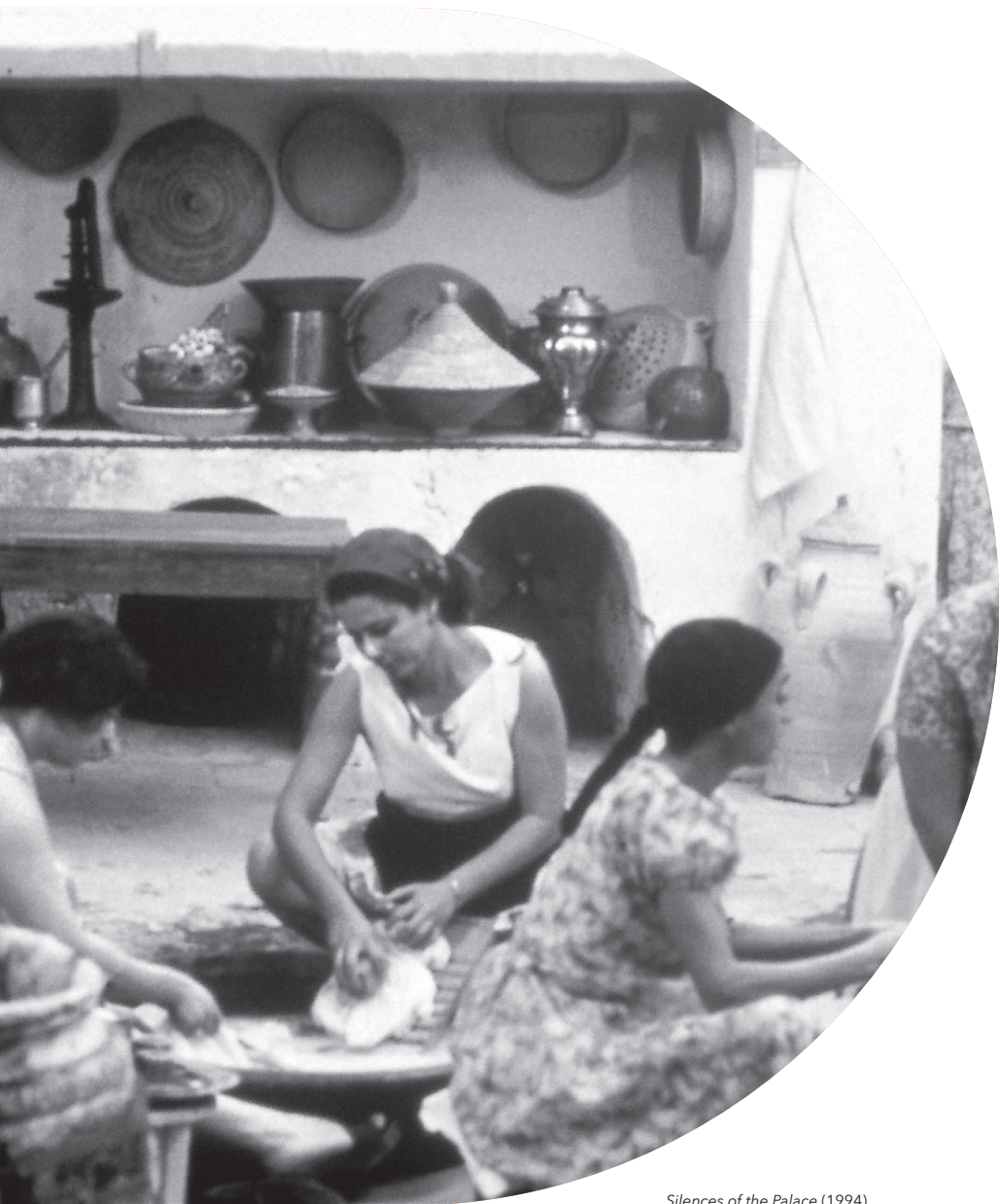
Silences of the Palace (1994)